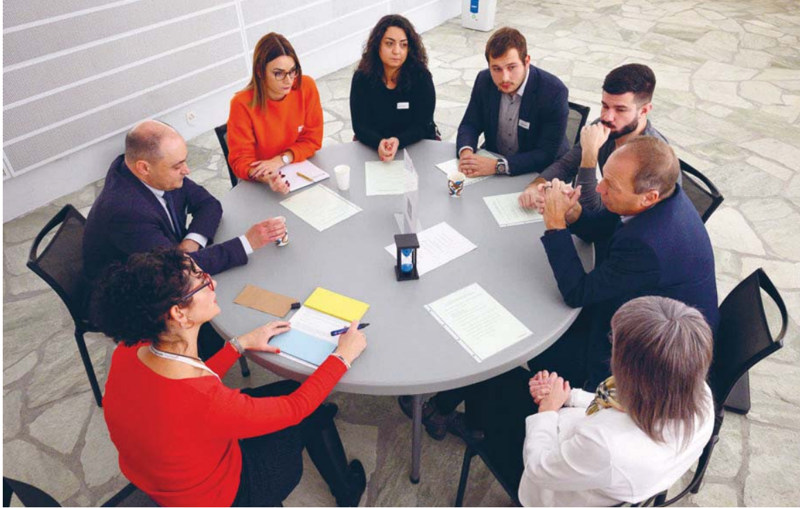
Au total, ce sont 28 sessions qui ont été organisées pour permettre aux 542 employés de vivre cet atelier.

trices à mettre en œuvre dans le cadre de l'activité de chacune et chacun pour contribuer à faire de la BCVs «l'entreprise de référence en Valais». Les sessions se sont enchaînées du 29 octobre 2019 au